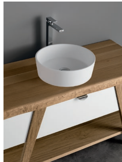
Tecnotek tondo - round - ronde 42,5x42,5x13,5 cm