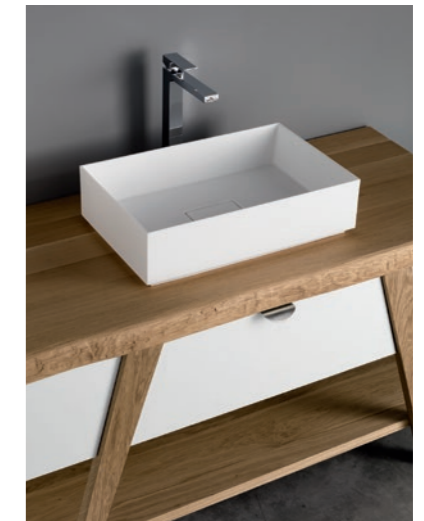
Tecnotek rettangolo - rectangular - rectangulaires 52,5x33,5x14 cm