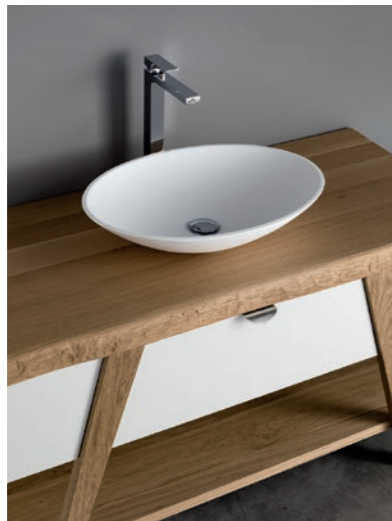
Tecnotek ovale - oval - ovals 57x41x12 cm