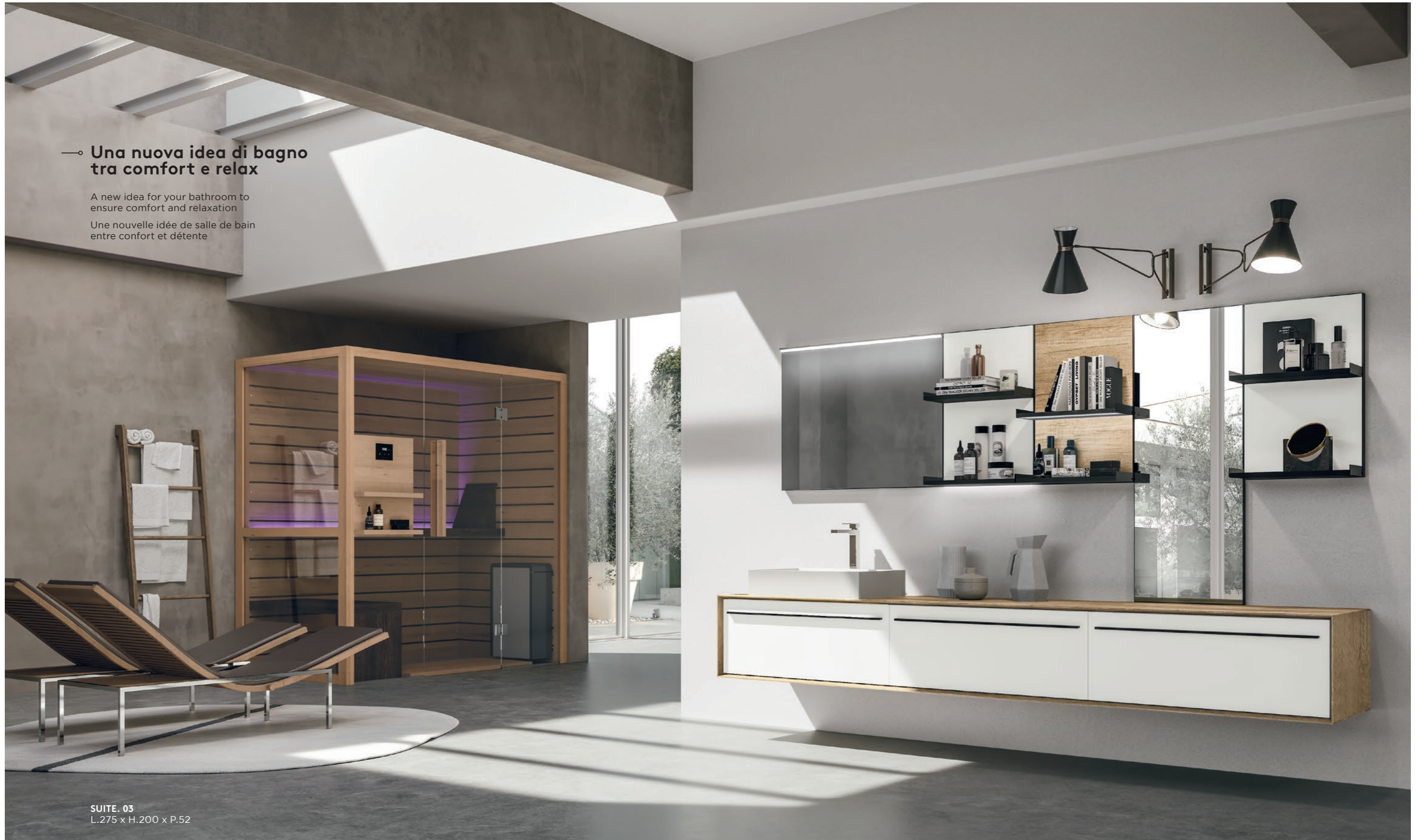
SUITE. 03 L.275 x H.200 x P.52

A new idea for your bathroom to ensure comfort and relaxation Une nouvelle idée de salle de bain entre confort et détente