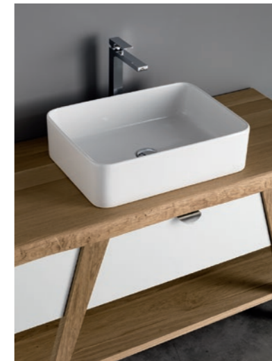
Up ceramica - ceramic - céramique 55x40x15 cm