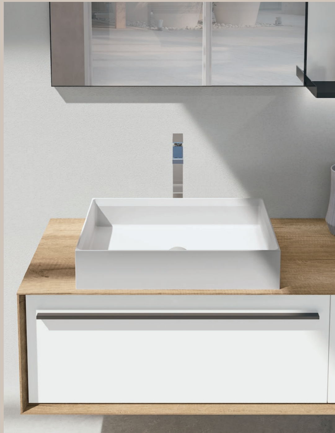
Lavabo in appoggio in Corian® bianco rettangolo 60 - Maniglia Griff nera

White Corian® 60 cm rectangular washbasin - Griff black handle